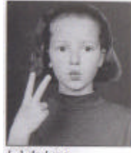
[y] de lune