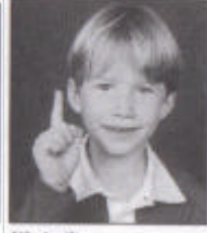
[i] de lit